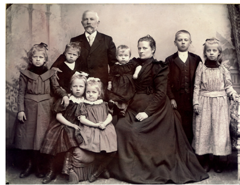
Familjen Wallengren från Landskrona. Foto privat.

Arkivarie Rolf Johansson lär ut grunderna i släktforskning.