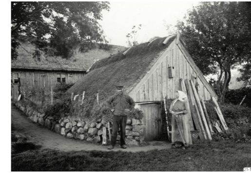
En potatiskällare i Växtorp 1921.