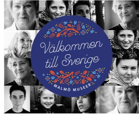
Katalog till utställningen Välkommen till Sverige .

Under våren och sommaren 1945 anlände tusentals överlevare från nazisternas koncentrationsläger till Malmö med de Vita bussarna. Det var svårt att hitta plats för alla kvinnor, män och barn. Alla tillgängliga förläggningar i skolor, idrottshallar och till och