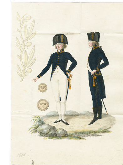
Svensk diplomatuniform från 1804.